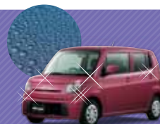
SGコート (ガラス系ポテターコーティング)