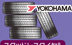
スタッドレスタイヤ& ホイール付 (組み付け、バランス調整込み)